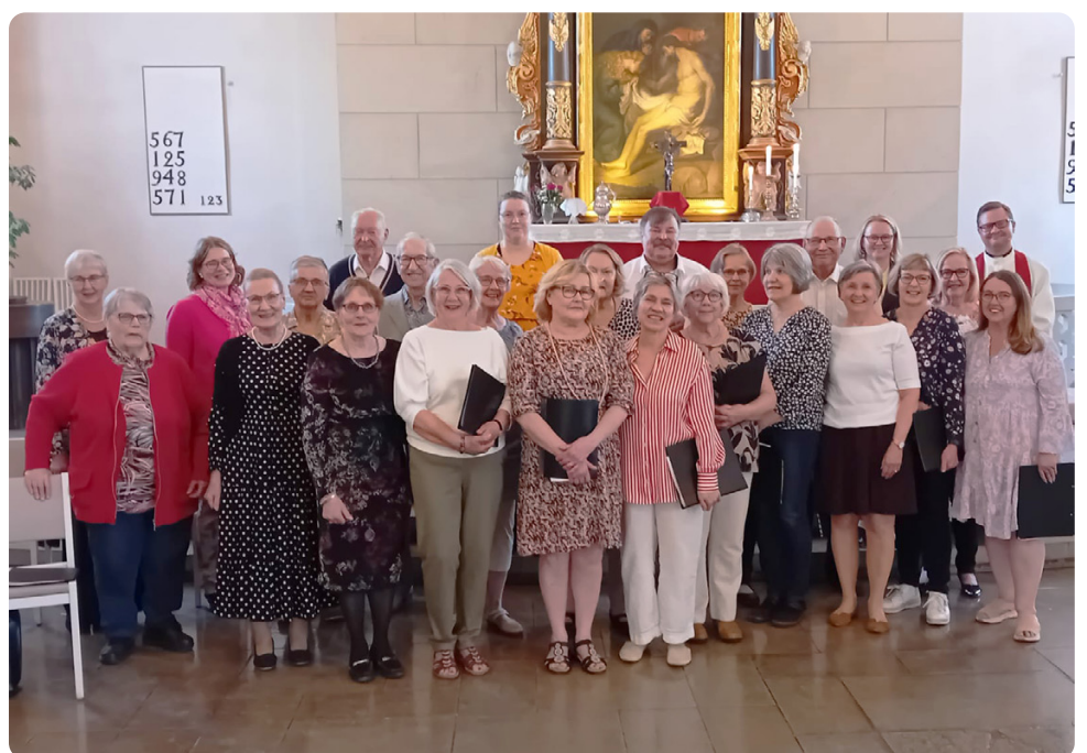
Kuorot yhteiskuvassa 22.5.24 Tammisaaren kirkossa pidetyn Keväisen Iltamessun päätteeksi

Tule sinäkin kokeilemaan kuorossa laulamista! Meillä ei pidetä koelauluja! Tämän jutun vierestä löydät kuorojen alkamisajat ja -paikat.