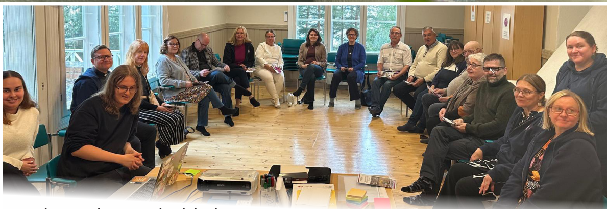
Työyhteisön, luottamushenkilöiden ja nuorten vaikuttajaryhmäläisten yhteinen suunnittelu- ja leiripäivä Rosvikin leirikeskuksessa.