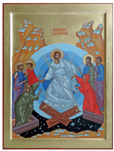
1. pääsiäispäivä: Kristuksen ylösnousemus