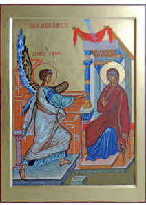
Marianpäivä: Marian ilmestyminen, arkkienkeli Gabriel ilmestyi Neitsyt Marialle ilmoittamaan Kristuksen tulevasta syntymästä.

sen maalaus näyttää vaiettu-vaan Nikean kirkolliskokous on vuonna 787 määritellyt ne Raamatun tekstin vastineiksi