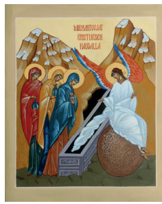
Mirhantuojat Kristuksen haudalla: "Miksi etsitte elävää kuolleitten joukosta?"