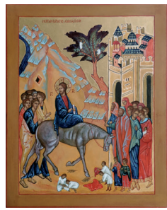
Palmusunnuntai: Kristus ratsastaa Jerusalemiin