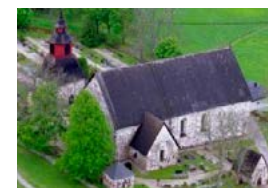
Tenholan kirkko Pitäjäntie 13 Tenhola