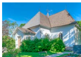
Mustion kirkko Hällsnäsintie 82 Mustio