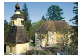
Snappertunan kirkko Snappertunan kirkkotie 91 Snappertuna