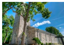
Tammisaaren kirkko Pikku Kirkkokatu 3 Tammisaari