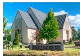
Bromarvin kirkko Bromarvintie 1850 Bromarv