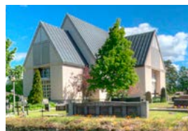
Bromarvin kirkko Bromarvintie 1850 Bromarv