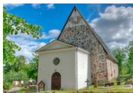
Pyhän Marian kirkko Vanha Turuntie 79 Pohjankuru