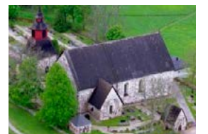
Tenholan kirkko Pitäjäntie 13 Tenhola