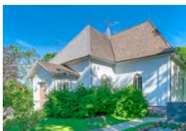
Mustion kirkko Hällsnäsintie 82 Mustio